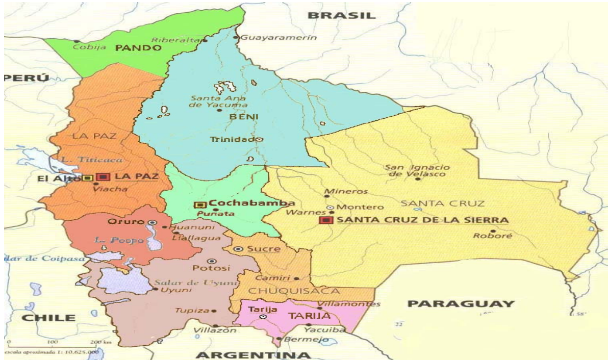
Figura 3: MAPA POLÍTICO DE BOLIVIA: Fuente: http://www.katari.org/bolivia/bolivia.htm

La ciudad de La Paz (ciudad donde se encuentra la Delegación de InteRed en Bolivia) se encuentra a 3.650 m. sobre el nivel del mar. Como antes hemos indicado, es la capital política de Bolivia (ya que la capital constitucional es la ciudad de Sucre). Tiene 1.552.156 habitantes (según el censo de población de 2001), y junto a la ciudad de El Alto, se considera el segundo núcleo poblacional y económico, tras la ciudad de Santa Cruz de la Sierra. El Departamento de La Paz, se encuentra entre los departamentos bolivianos con un Índice de Desarrollo Humano más alto del país (0,631), superado sólo por los departamentos de Santa Cruz y Beni. El municipio de La Paz, es el cuarto municipio en IDH del país, superado sólo por los municipios de Cochabamba, Santa Cruz de la Sierra y Camiri.