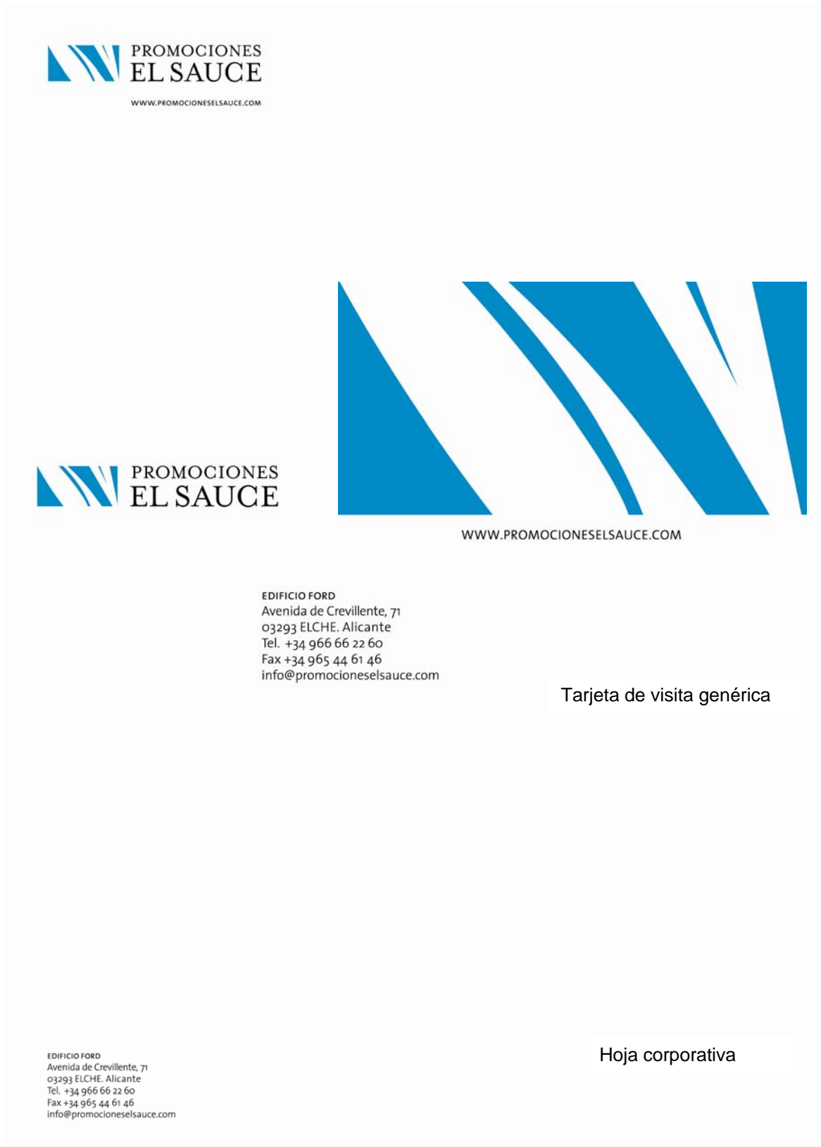
Tarjeta de visita genérica